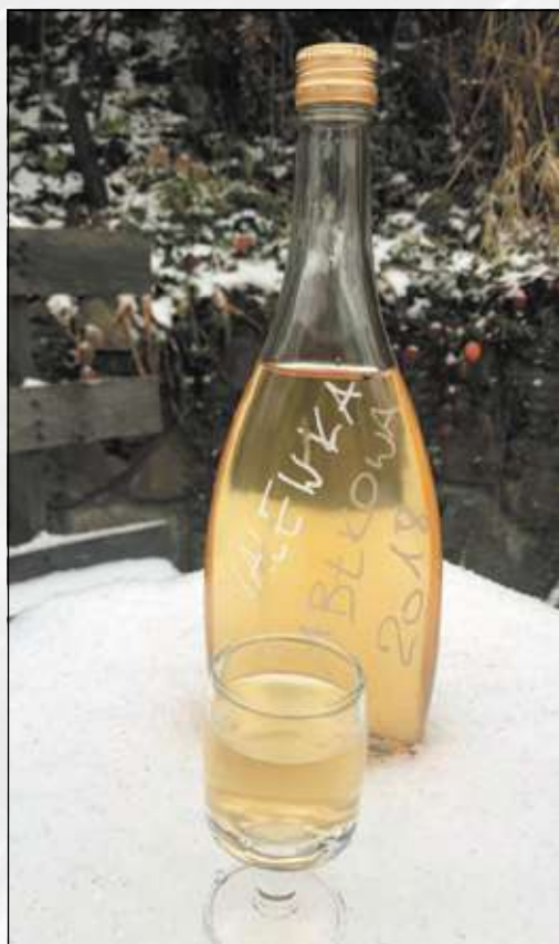
❖ Ulla Pałka

Te i więcej przepisów na stronie: www.kuchnianawzgorzu.pl oraz na profilu na facebooku: www.facebook.com/kuchnianawzgorzu